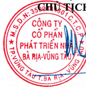
Đoàn Hữu Thuận