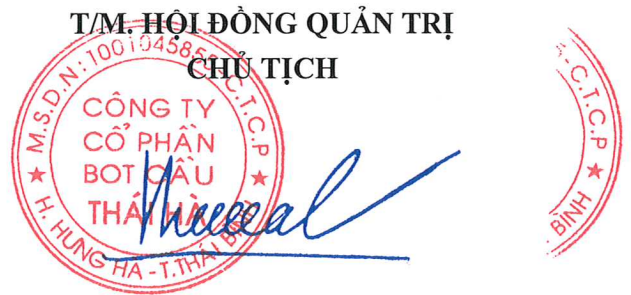
NGÔ TIẾN CƯƠNG