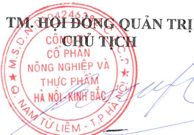
Dương Quang Lư

Quy chế này gồm 04 trang, 11 điều, có hiệu lực ngay khi Đại hội thông qua, là cơ sở để Đại hội bầu cử thành viên Hội đồng quản trị, Ban kiểm soát nhiệm kỳ 2024 - 2029.