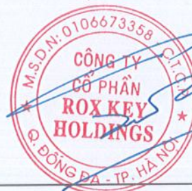
TRẦN XUÂN QUẢNG Chủ tịch HĐQT