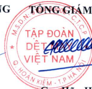
Cao Hữu Hiếu