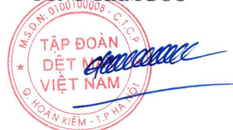
Cao Hữu Hiếu