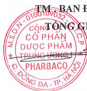
Tô Thành Hưng