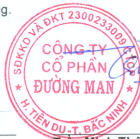
Trần Minh Thông Chủ tịch Hội đồng Quản trị Ngày 29 tháng 03 năm 2024