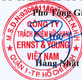
Hàng Nhật Quang