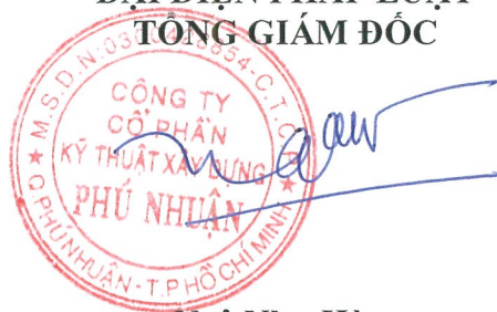
Ngô Như Hùng