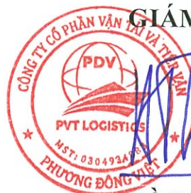
Hồ Sĩ Thuận