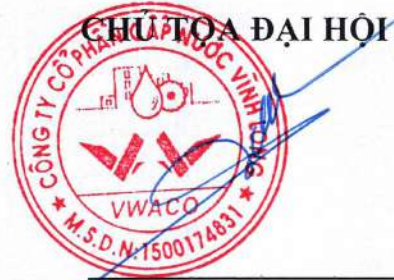
Đặng Tấn Chiến Chủ tịch Hội đồng quản trị