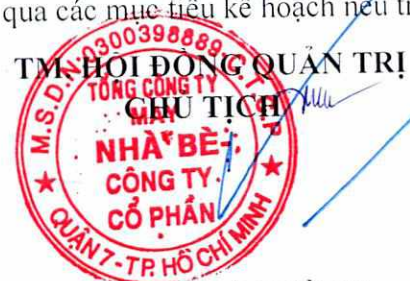
PHẠM PHÚ CƯỜNG

Kính đề nghị đại hội đồng cổ đông xem xét và thông qua các mục tiêu kế hoạch nêu trên.