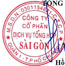
Hồ Việt Hà