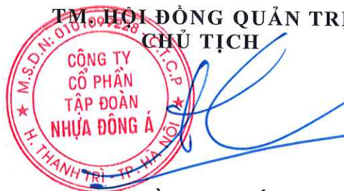
Trần Việt Thắng