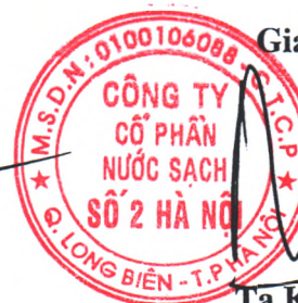
Tạ Kỳ Hưng