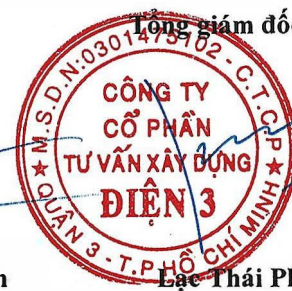
Lạc Thái Phước