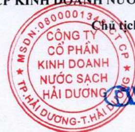
Vũ Mạnh Dũng

(Các thuyết minh từ trang 6 đến trang 28 là bộ phận hợp thành của Báo cáo tài chính giữa niên độ này)