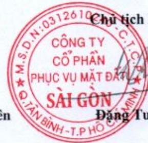
Đặng Tuấn Tú