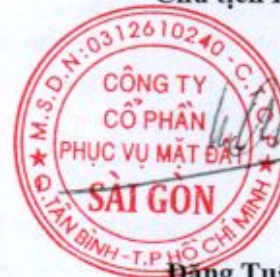
Đặng Tuấn Tú