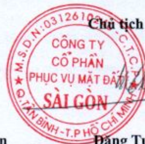
Đặng Tuấn Tú