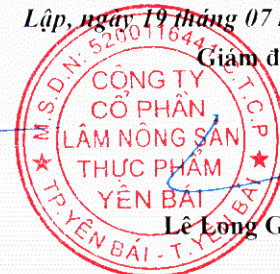
Lê Long Giang

11 12 13 14 15 16 17 18 19 20 21 22 23 24 25 26 27 28 29 30 31 32 33 34 35 36 37 38 39 40 41 42 43 44 45 46 47 48 49 50 51 52 53 54 55 56 57 58 59 60 61 62 63 64 65 66 67 68 69 70 71 72 73 74 75 76 77 78 79 80 81 82 83 84 85 86 87 88 89 90 91 92 93 94 95 96 97 98 99 100