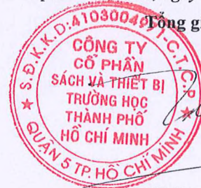
Từ Trung Đan