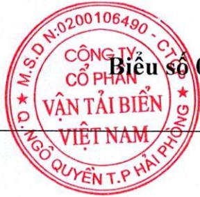
Biểu số 02: Danh sách người nội bộ và người có liên quan của người nội bộ của VOSCO