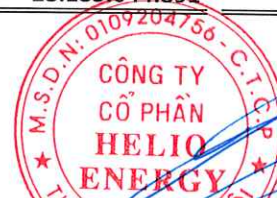
Phan Thành Đạt Chủ tịch Hội đồng quản trị