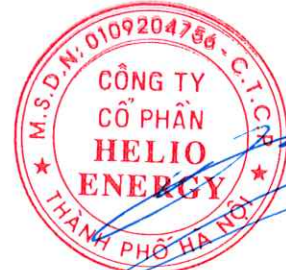
Phan Thành Đạt Chủ tịch Hội đồng quản trị