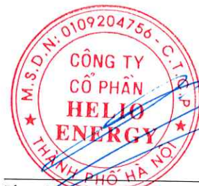
Phan Thành Đạt Chủ tịch Hội đồng quản trị