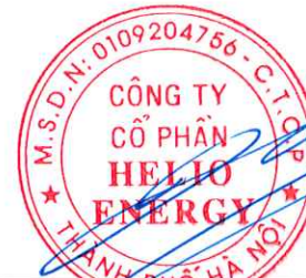
Phan Thành Đạt Chủ tịch Hội đồng Quản trị