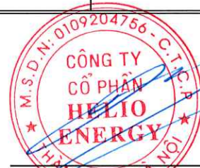
Phan Thành Đạt Chủ tịch Hội đồng Quản trị