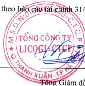
Tổng Giám đốc