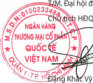
Đặng Khắc Vỹ

T/M. Đại hội đồng Cổ đông VIB Chủ tịch HĐQT - Chủ tọa Đại hội