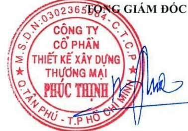
TRẦN MINH TRÚC