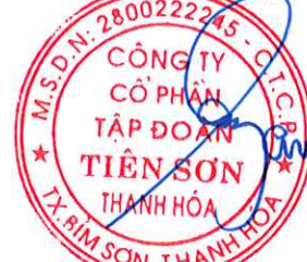
Trình Xuân Lượng