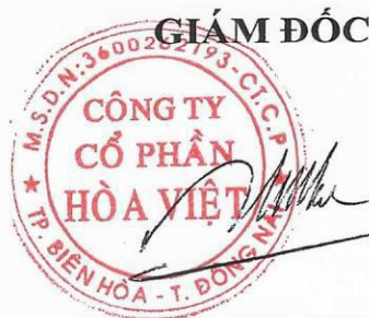
Lương Hữu Hưng