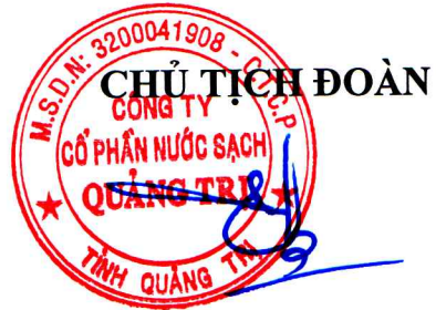
Đào Bá Hiếu