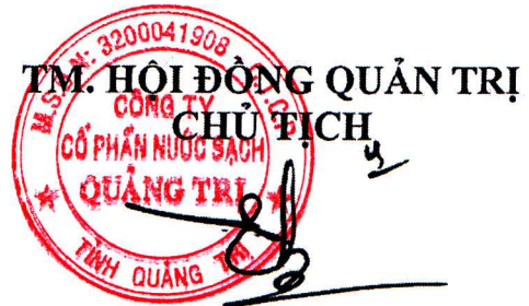
Đào Bá Hiếu