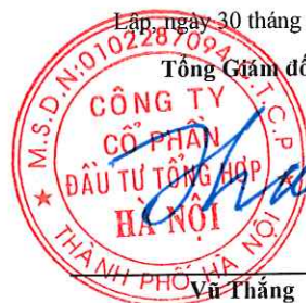
Thắng Vũ Thắng