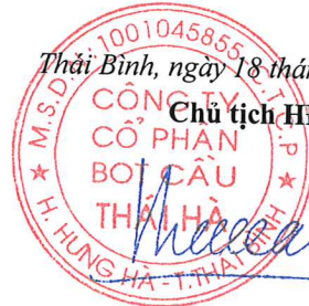
Ngô Tiến Cường