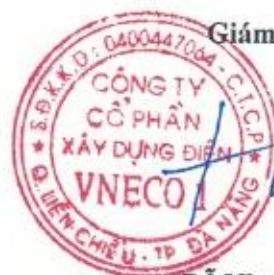
Đỗ Như Hiệp