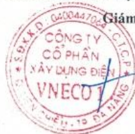
Đỗ Như Hiệp

(Các thuyết minh từ trang 05 đến trang 19 là bộ phận hợp thành của Báo cáo tài chính này.)