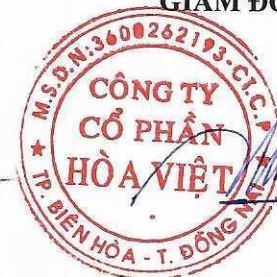
Lương Hữu Hưng