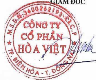
Lương Hữu Hưng