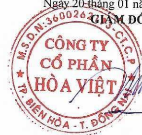
Lương Hữu Hưng