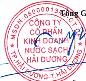
Nguyễn Thanh Sơn

(Các thuyết minh từ trang 6 đến trang 28 là bộ phận hợp thành của Báo cáo tài chính giữa niên độ này)