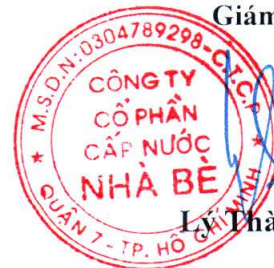
Lý Thành Tài