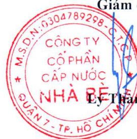
Lý Thành Tài