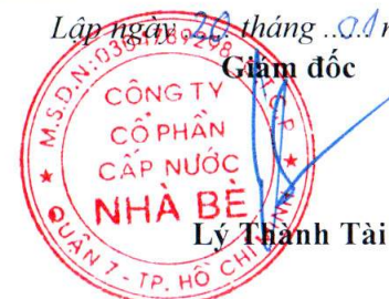
Lý Thành Tài