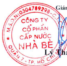
Lý Thành Tài