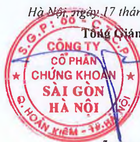
Nguyễn Chí Thành