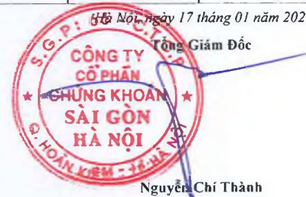
Nguyễn Chí Thành