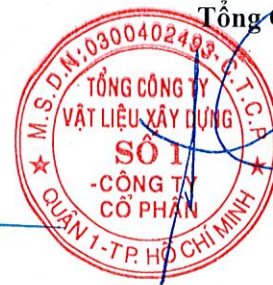
Cao Trường Thọ