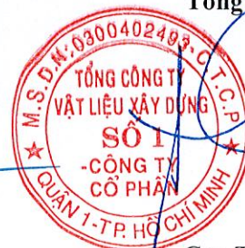
Cao Trường Thọ