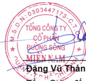
Đặng Vũ Thành