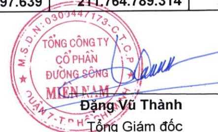
Đặng Vũ Thành