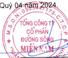
Đặng Vũ Thành