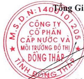
Đinh Công Phú