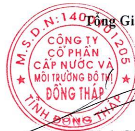
Đinh Công Phú