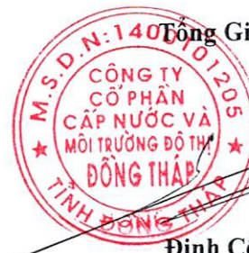
Đinh Công Phú