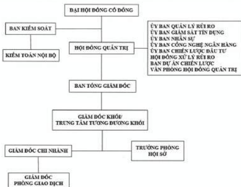
Hình 2: Cơ cấu quản trị và bộ máy quản lý của HDBank