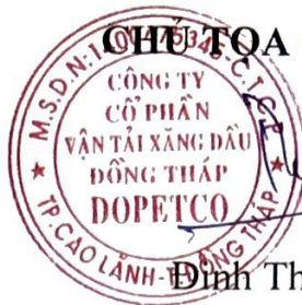
Đinh Thiện Hiền