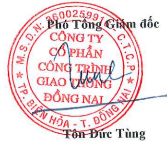
Tôn Đức Tùng