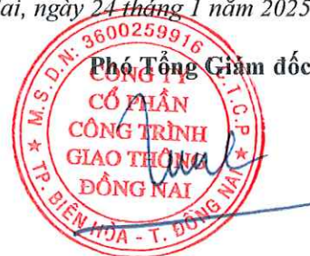
Tôn Đức Tùng