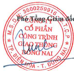
Tôn Đức Tùng