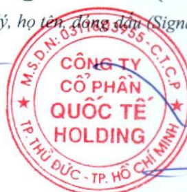
Đặng Thúy Vy