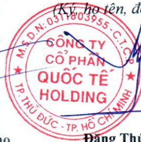
Đặng Thúy Vy