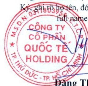
Đặng Thúy Vy

Ký, ghi rõ họ tên, đóng dấu (Sign, print full name, stamp)