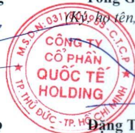
Đặng Thúy Vy