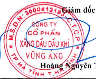
Hoàng Nguyên Thanh

Các thuyết minh từ trang 7 đến trang 35 là bộ phận hợp thành của Báo cáo tài chính