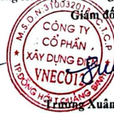
Trương Xuân Phúc