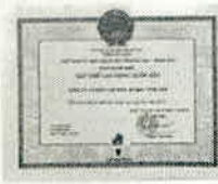
TẬP THỂ LAO ĐỘNG XUẤT SẮC