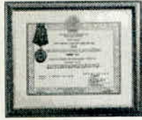
HUÂN CHƯƠNG LAO ĐỘNG HẠNG NHẤT