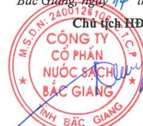
HƯƠNG XUÂN CÔNG