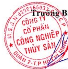
Võ Quốc Việt