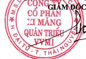
Trần Việt Cường