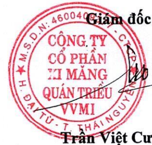
Trần Việt Cường