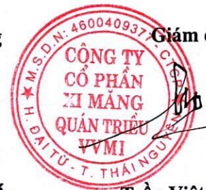
Trần Việt Cường