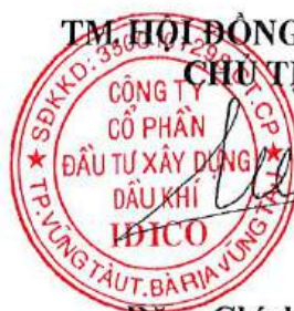
Đặng Chính Trung